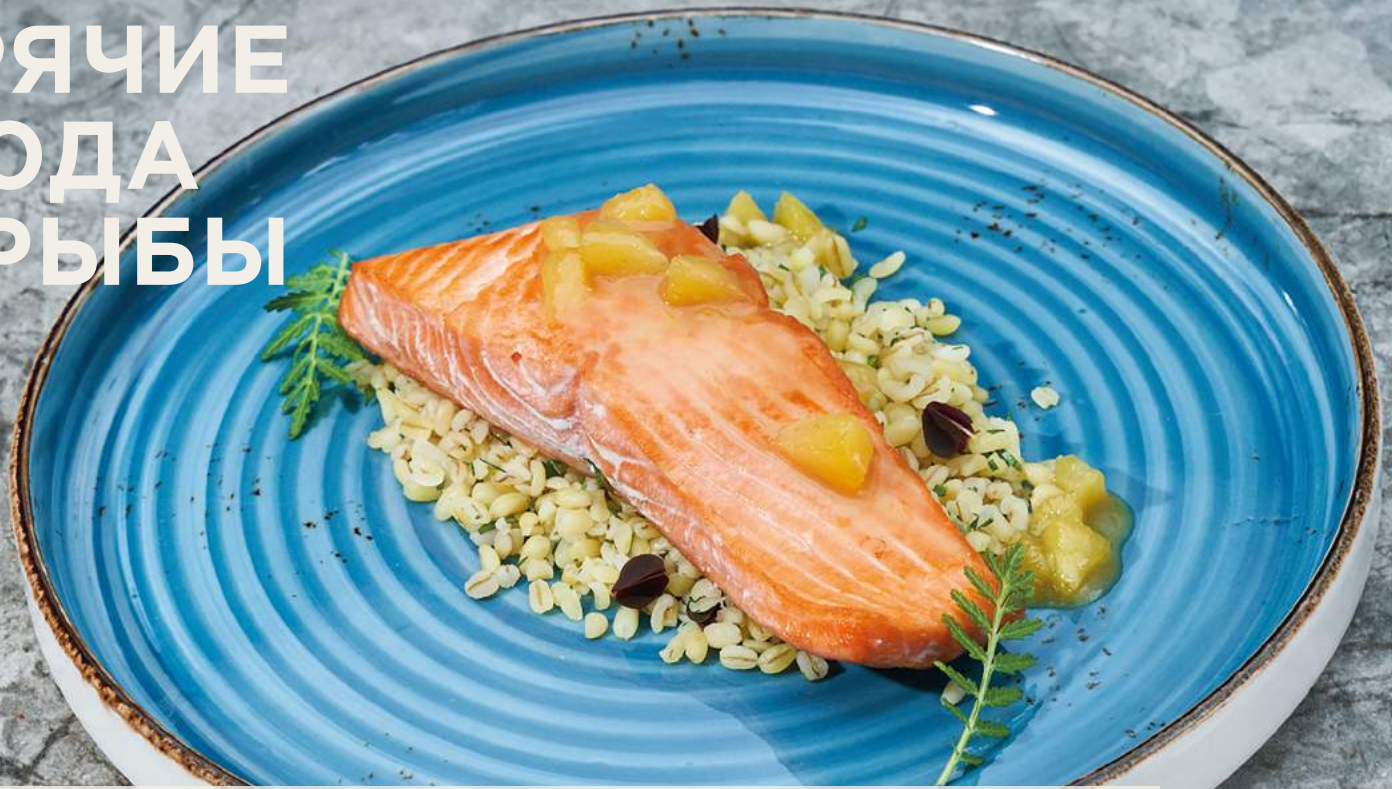
Филе форели с булгуром и цитрусами