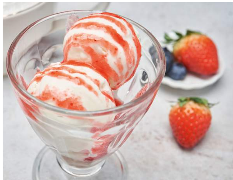
Мороженое с топингом